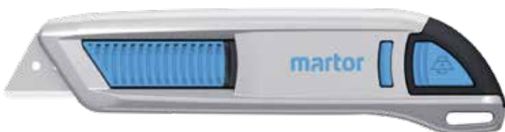
Hoja montada: N.º 65232