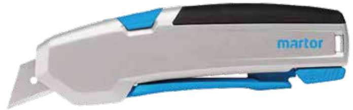
Hoja montada: N.º 60099