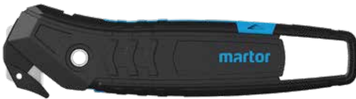
Hoja montada: N.º 3550