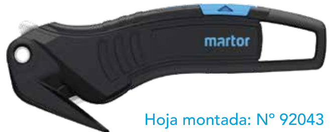
Hoja montada: N.º 92043